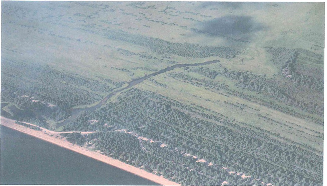
3. Чивыркуйский перешеек