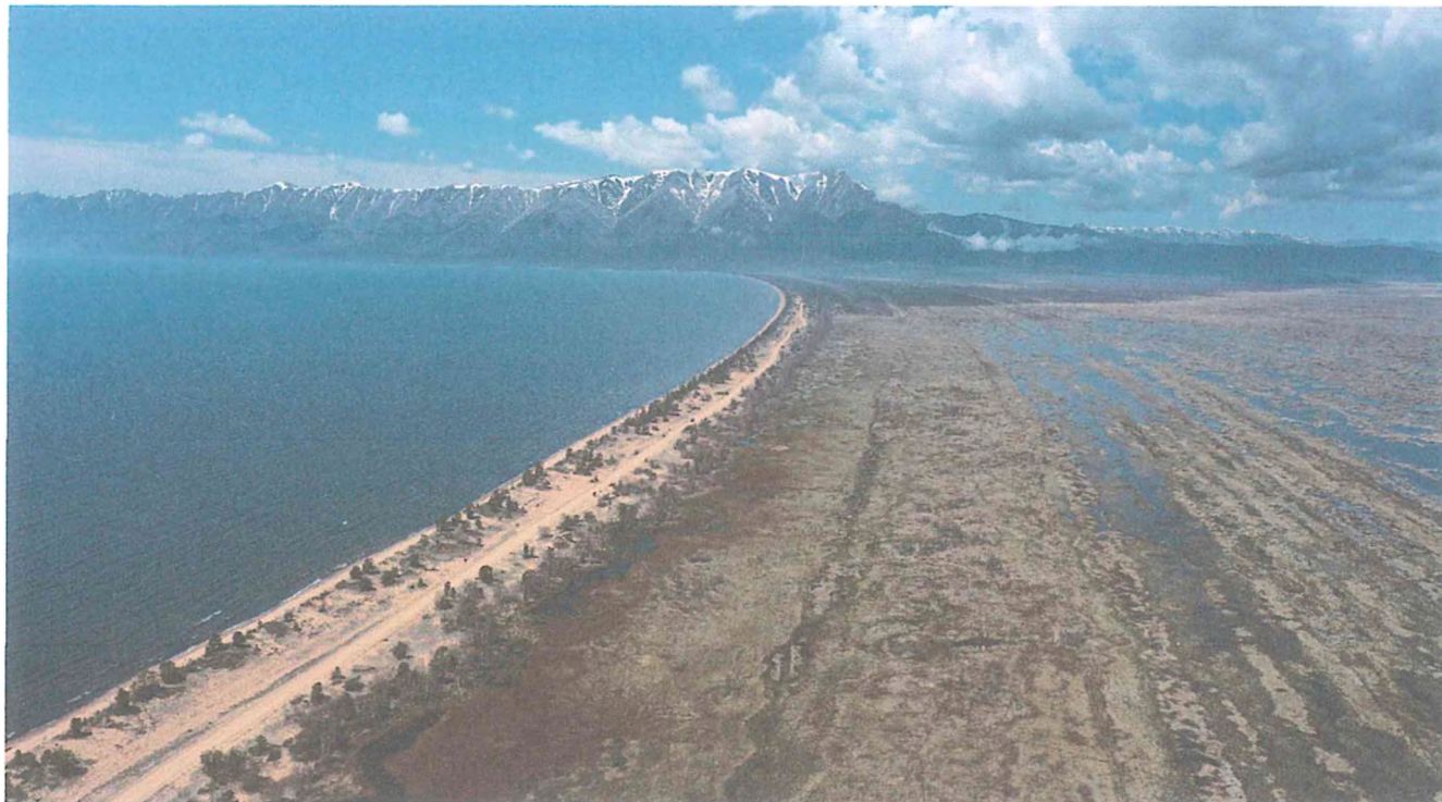
1. Чивыркуйский перешеек, Баргузинский залив, полуостров Святой нос.