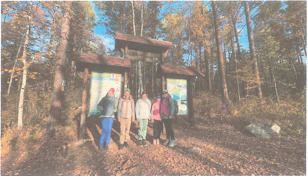
3. Входная группа.