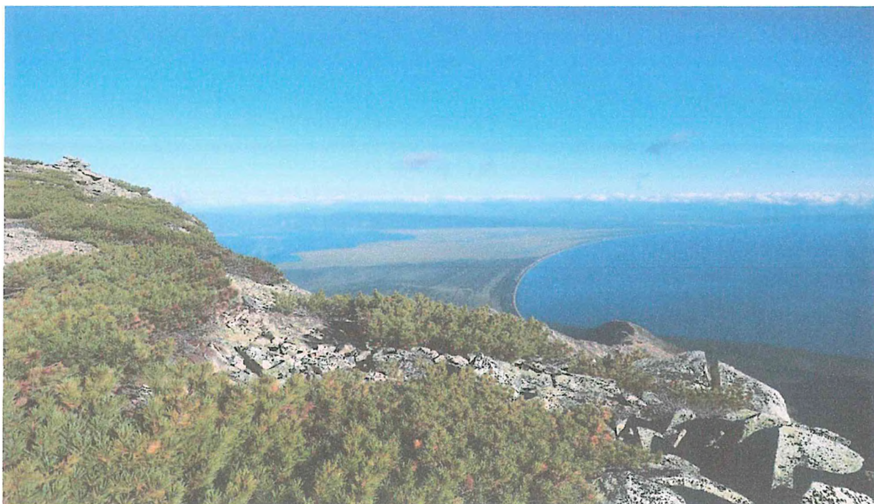
1. Баргузинский залив (вид с п-ва Святой Нос).