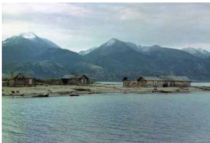
5. Дома рыбаков, впоследствии затонувшие

Особенно низкий уровень воды, на нашей памяти, отмечался в 2013–2018 годах (фото 3). Тогда говорили, что отметки приблизились к тому уровню, каким он был до строительства Иркутской ГЭС.