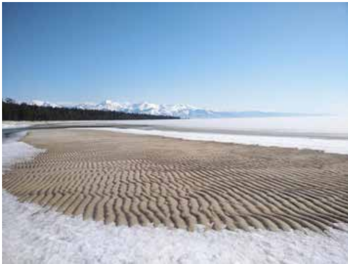
3. Берег Черского, обмеление