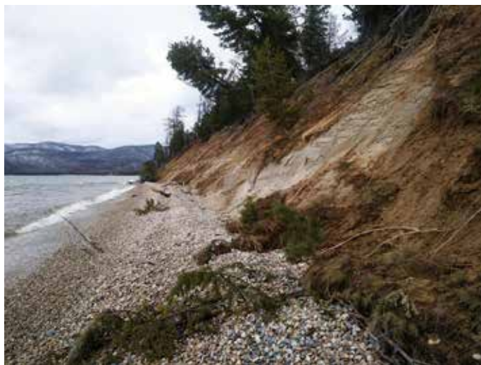
4. Обрушение берега, бухта Давша

После вмешательства Иркутской ГЭС жизнь Байкала стала подвластной человеку. Колебания уровня воды наносят большой урон прибрежным экосистемам (фото 1, 2, 4).