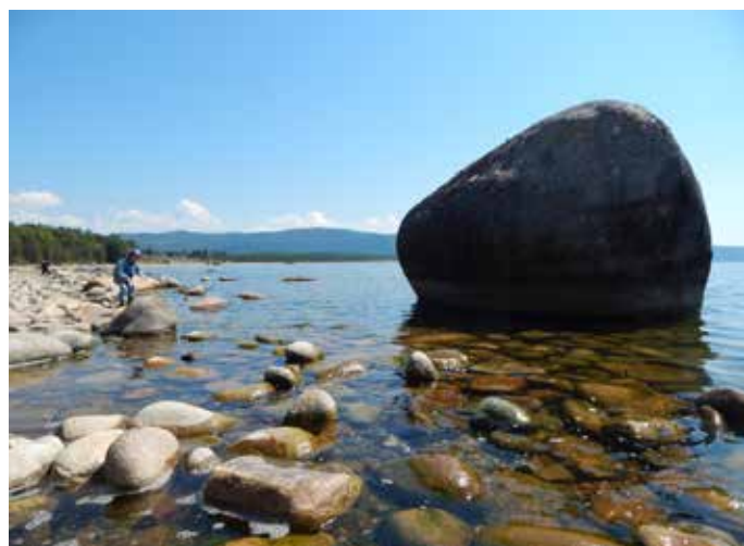
2. Затоплены местообитания эндемика Байкала щучки Турчанинова, 2020 г.