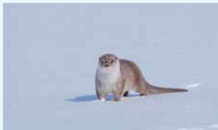
Речная выдра в Баргузинском заповеднике

Но, конечно, не только ходили под рюкзаками, наматывая километры. Ещё и записывали суточные следы на снегу, которые оставляют соболи,