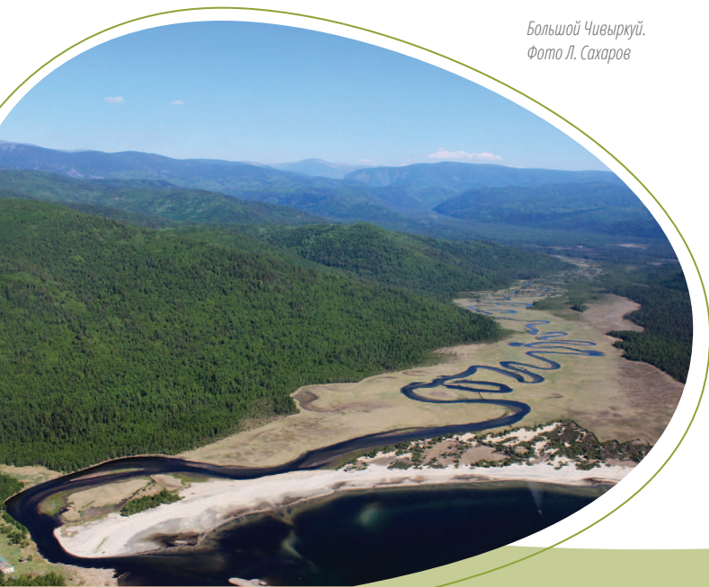
Большой Чивыркуй.

– одно из интересных и наиболее посещаемых мест на Байкале. Он расположен на территории Забайкальского национального парка, входит в территорию Байкальского участка Всемирного природного наследия и обладает уникальными природными характеристиками.