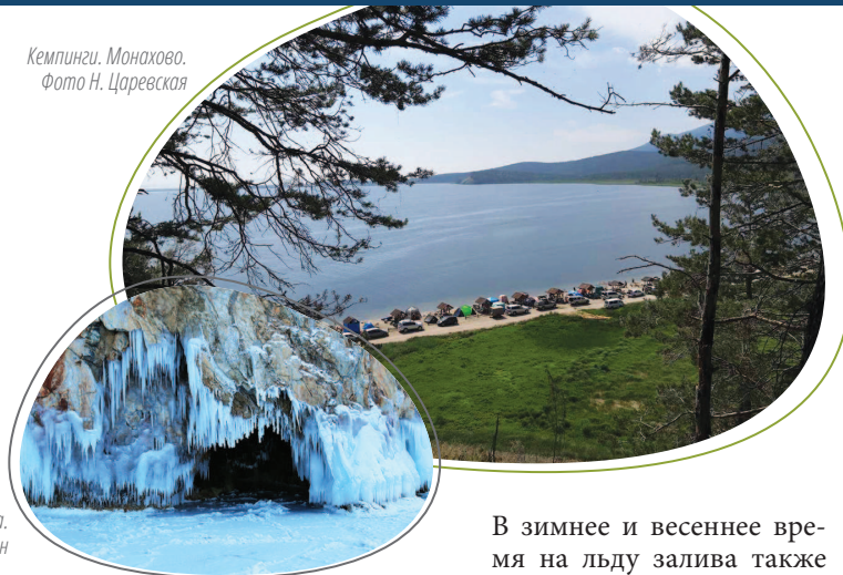
Кемпинги. Монахово.