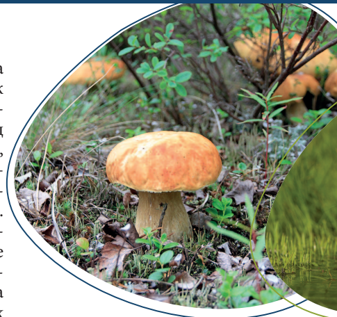
Белые грибы, боровички.

встречаются пузырчатка средняя, болотноцветник щитолистный, роголистник погруженный, горец земноводный, рдесты, и, конечно, красавицы – кувшинка четырёхугольная и кубышка малая. Фрагментарно встречаются реликтовые степные сообщества, которые располагаются в основном на южных крутых склонах мысов и островов.