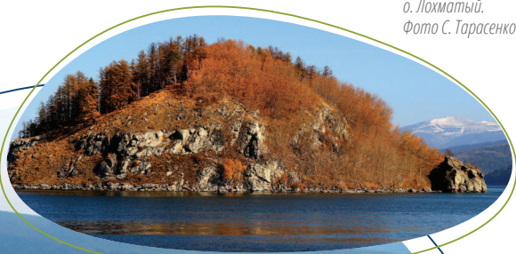
о. Лохматый.