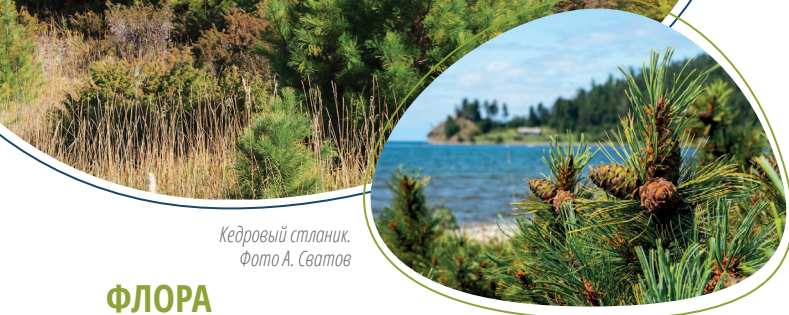
Кедровый стланик.