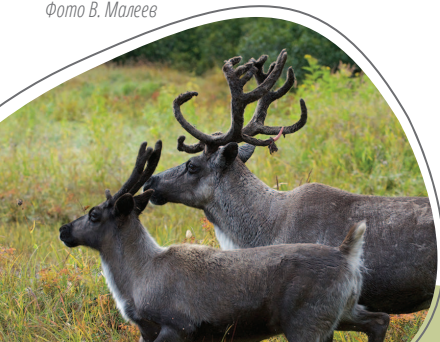
Северный олень.

Чивыркуйский залив богат рыбой, поэтому, испокон веков здесь развито традиционное и любительское рыболовство. Летом ловятся окуни, сорога и щуки, среди которых попадаются особи весьма внушительных размеров. Залив всегда был одним из главных мест рыбной ловли для крупных рыбопромышленников. Славится прекрасной любительской рыбалкой, как летом, так и зимой.