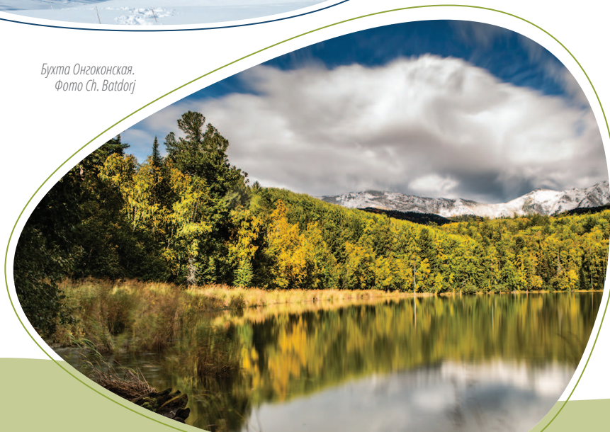
Бухта Онгоконская.

На территории национального парка запрещается нахождение без разрешения. Разрешения выдаются на контрольно-пропускном пункте и в офисе ФГБУ «Заповедное Подлеморье». Просим внимательно ознакомиться с общими правилами пребывания на территории. Их незнание не освобождает Вас от ответственности. Мы уверены, что у Вас отсутствуют привычки что-либо собирать, срывать, ломать, портить, разбрасывать мусор, вырезать, строить, мастерить, копать ямы. Цените и берегите природу и инфраструктуру троп. В парке имеются контейнеры для мусора. Если есть возможность, выносите (вывозите) мусор с собой. Уважение и благодарность тем, кто собирает мусор, брошенный другими. Нельзя разводить костры и обустривать лагерь на новых местах, для отдыха и ночлега пользуйтесь специально обустроенными стоянками, кемпингами, туристическими приютами. В местах туристических стоянок (кемпингах) есть туалеты.