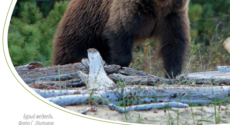
Бурый медведь.

шими бакланами. Встречаются серая цапля, речная крачка, чеграва, кряква, огарь, обыкновенная пустельга, рябчик, каменный глухарь, филин, оляпка, чёрная ворона, дубровник. Высоко в горах обитают белая и тундрная куропатки.