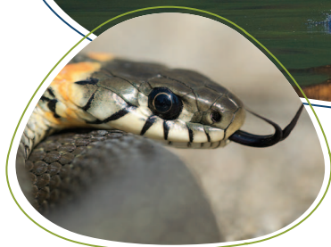
Обыкновенный уж.