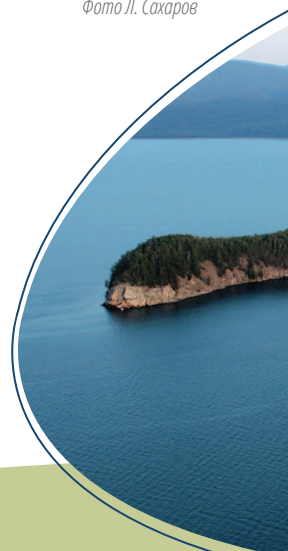
о. Бакланий.

Вода по своему химическому составу гидрокарбонатно-сульфатно-натриевая. Сероводорода в ней содержится от 10 до 23 мг/л, поэтому его запах улавливается в 500-600 м от источника. Температура воды выше +40° С. Целебная вода горячих