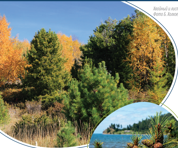
Хвойный и лиственный лес.