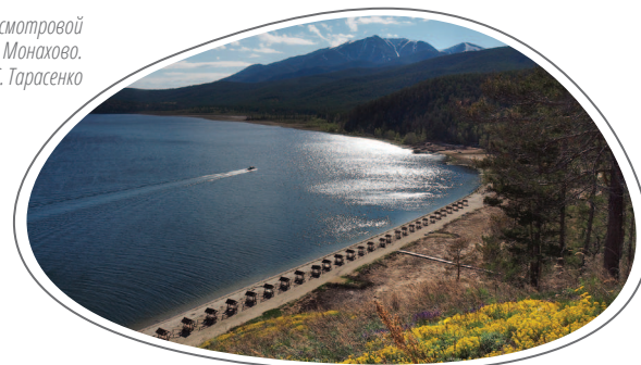
Вид со смотровой площадки на м. Монохово.

Слово «Чивыркуй» очень распространено в Забайкальском национальном парке - залив, перешеек, реки (Большой и Малый Чивыркуй), посёлок (когда-то существовавший на территории национального парка) носят это название.