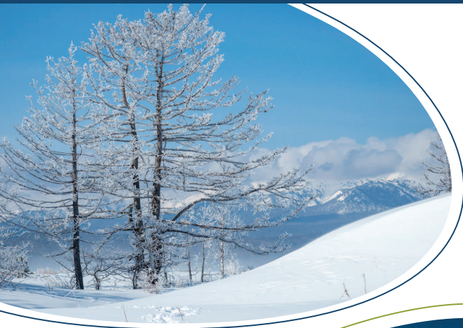
Зима в Чивыркуйском заливе.

Если вы решили совершить путешествие в «Чивыркуйскую сказку», то Вам необходимо знать и соблюдать несколько несложных правил.