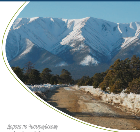
Дорога по Чивыркуйскому перешейку.

Дорога к заливу проходит через перешеек. Издревле здесь жили люди в трёх небольших посёлках: Монахово, Катунь и Курбулик. Рыболовство являлось важной частью их повседневной жизни. В связи с удобными подъездными путями и близостью расположения местность Монахово и сегодня одно из самых посещаемых мест отдыха.