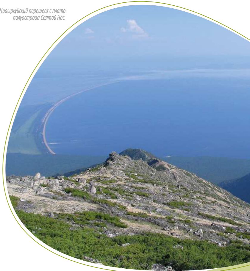
Вид на Чивыркуйский перешеек с плато полуострова Святой Нос.

Самых выносливых ждёт дальнейший подъём и гигантское плато - вершина Святого Носа. Наградой за все испытания служит панорама открывающихся отсюда невероятной красоты лежащих внизу ландшафтов: потрясающий вид на Баргузинский и Чивыркуйский заливы, Чивыркуйский перешеек с его озёрами и болотами, Ушканьи острова и свинцовую гладь Байкала.