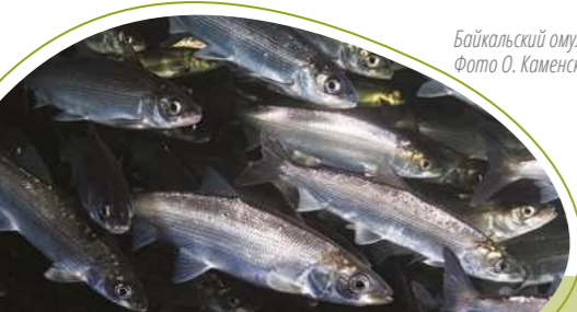
Байкальский омуль.

Из рыб в Баргузинском заливе наиболее многочисленны и разнообразны - широколобки и голомянки, из промысловых видов - омуль, сиг, хариус. Встречается байкальский осётр, занесенный в Красную книгу России.