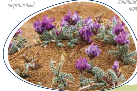
Череплодник почтишерстистый.