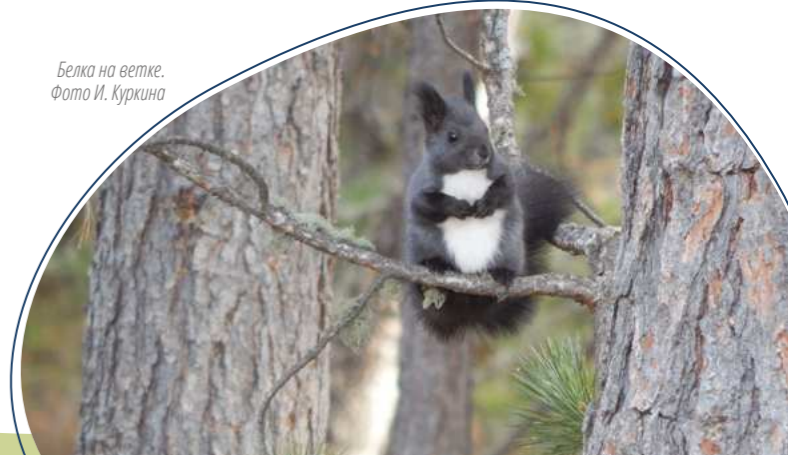
Белка на ветке.

В лесах Святого Носа водятся медведь, белка, соболь, ласка, горноста́й, колонок. Из копытных здесь встречаются косуля, лось, изюбр. Перелески и калтусы Чивыркуйского перешейка облюбовали заяц-беляк и лисица, водоѐмы и болота – ондатра и выдра.