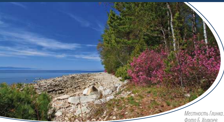
Местность Глинка.

ГЛИНКА - место, расположенное у подножия Святого Носа. К этой местности ведёт узкая просёлочная дорога прямо вдоль берега Байкала.