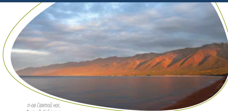
п-ов Святой нос.

Удивительны песчаные дюны МЯГКОЙ КАРГИ . Такое название получило урочище в виде неширокой песчаной косы от устья реки Баргузин до полуострова Святой Нос. Возраст Мягкой Карги определяется современными исследователями в 9-11 тыс. лет, что согласуется с расчётами Г.И. Галазия и Г.А. Дмитриева.