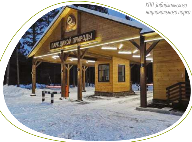
КПП Забайкальского национального парка

Большинство посетителей Забайкальского национального парка стремятся посетить одно из интересных и заманчивых мест – Святой Нос, единственный полуостров на Байкале, и покорить его вершину. Предлагаем Вам совершить путешествие по этому познавательному маршруту и познакомиться с его достопримечательностями на страницах нашего буклета. И, кто знает, возможно, следующим нашим гостем станете именно вы!